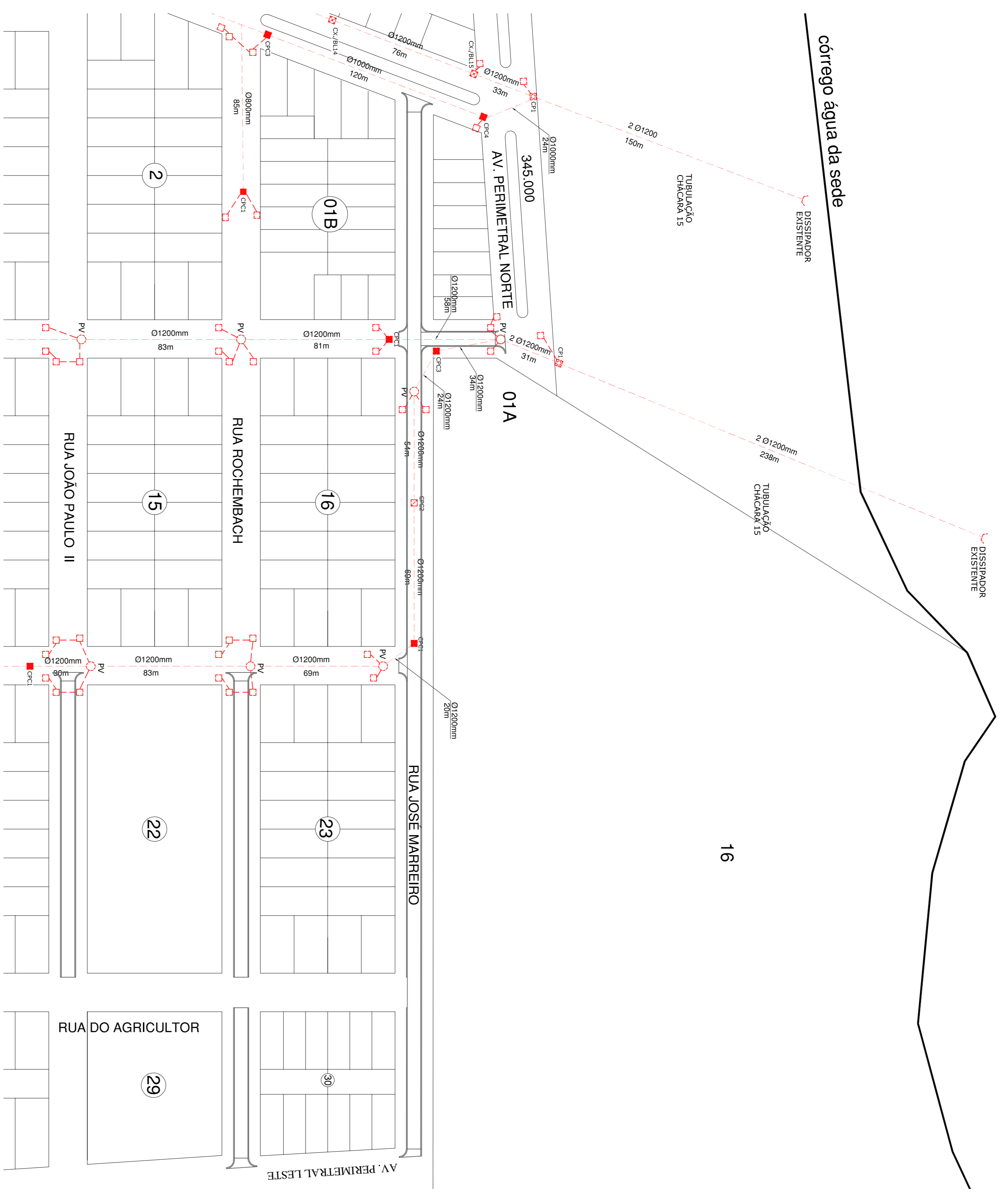
DRENAGEM PLANTA GEOMÉTRICA ESCALA 1/1400